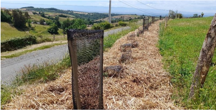
Figure 1. paillage optimal

Le paillage est obligatoire. Il s'applique une fois la plantation réalisée. Il permet :