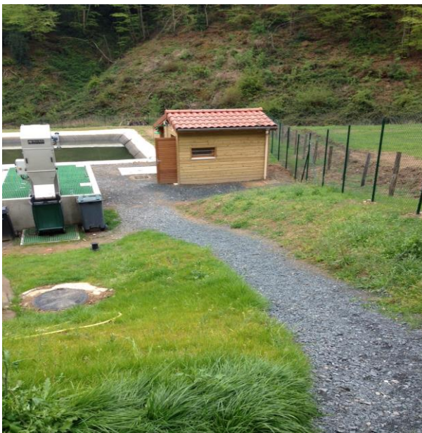
St Martin en Haut construction station de Thibert

Une réflexion est en cours pour étendre le transfert de la compétence à l'ensemble des communes composant le territoire.